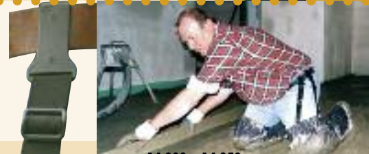
модель 14.000 + 14.050

Материал полностью водонепроницаем и прочен на износ.