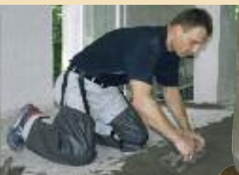
модель 12.050 + 12.070