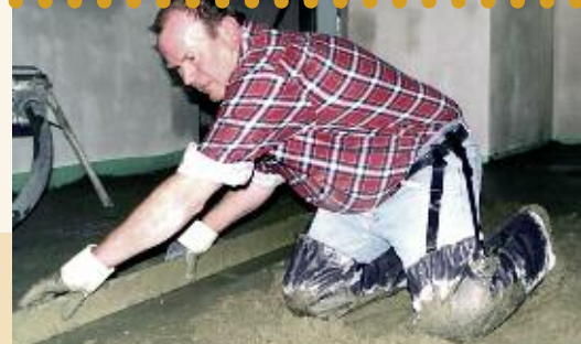
Modèle 14.000 + 14.050 + 14.060

Livrable aussi avec des boutons en métal, au même prix.